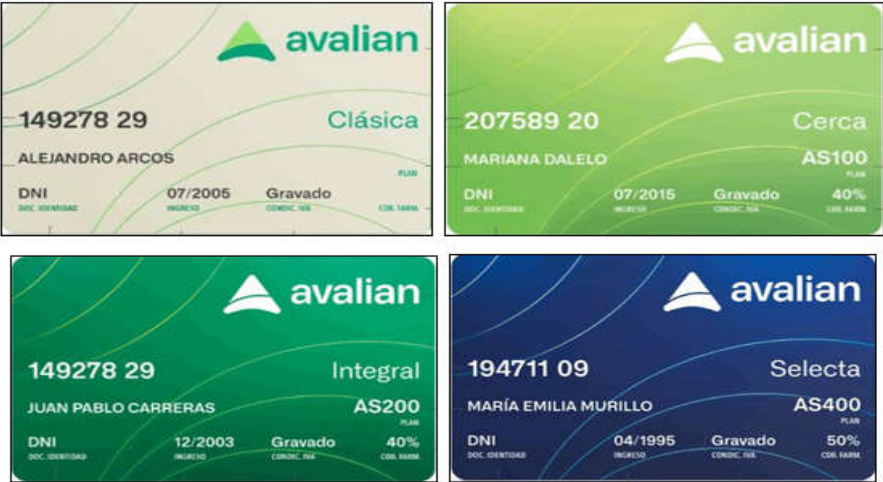
Exclusivo Plan PMO